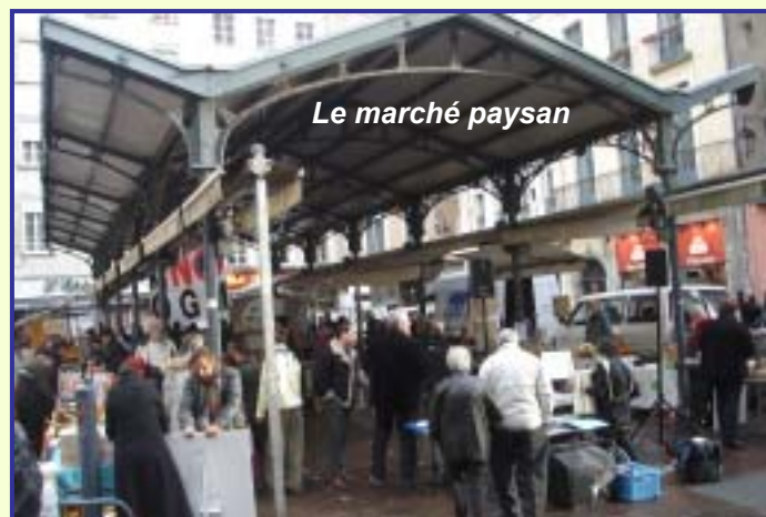
Le marché paysan

La phase d'installation est rendue un peu laborieuse par un stationnement difficile, mais on a affaire à des gens expérimentés qui acceptent volontiers les consignes d'installation des responsables. Tout est en place assez vite.