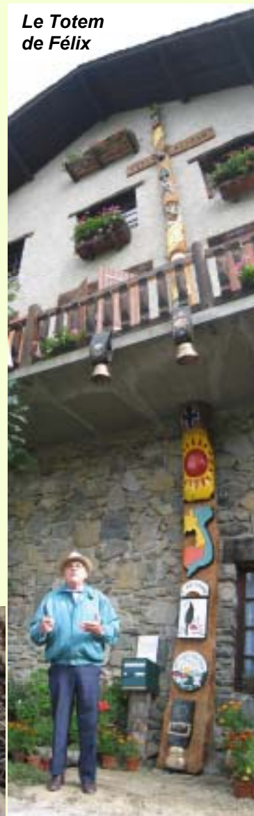
Le Totem de Félix