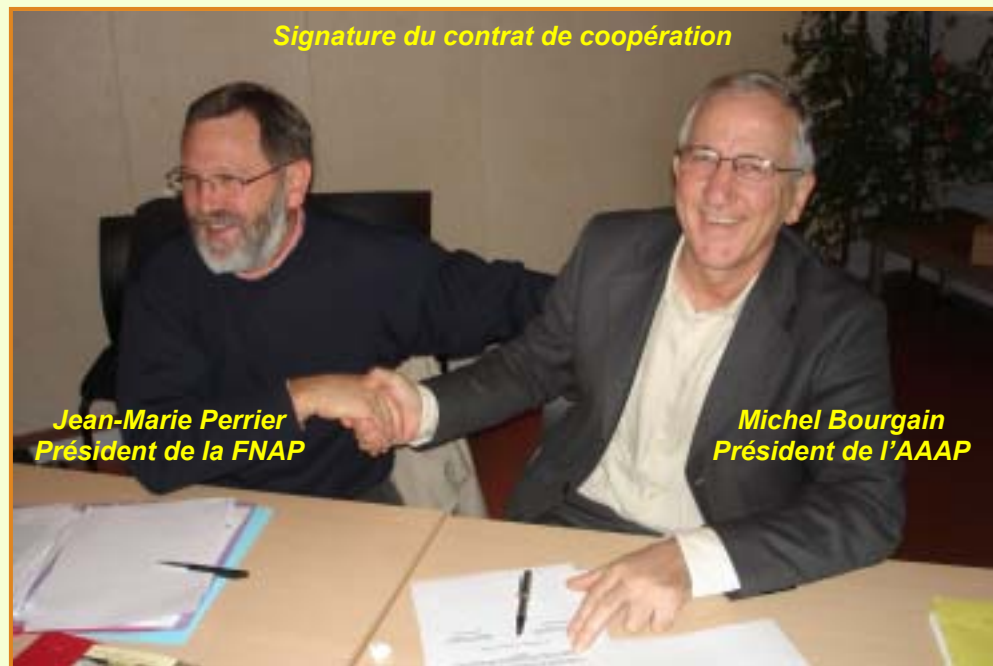
Signature du contrat de coopération

La quatrième Assemblée Générale du 17 novembre 2007 à Vigeville (Creuse) a permis de constater que la dynamique d'activités de notre association se révèle efficace pour soutenir le rayonnement d'Accueil Paysan.