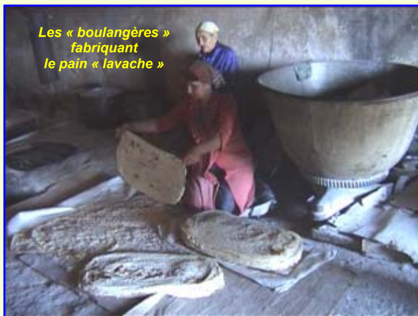
Les « boulangères » fabriquant le pain « lavache »