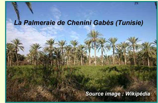
La Palmeraie de Chenini Gabès (Tunisie)