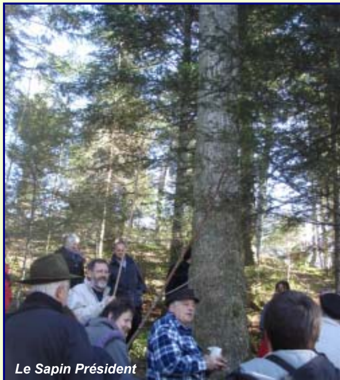
Le Sapin Président