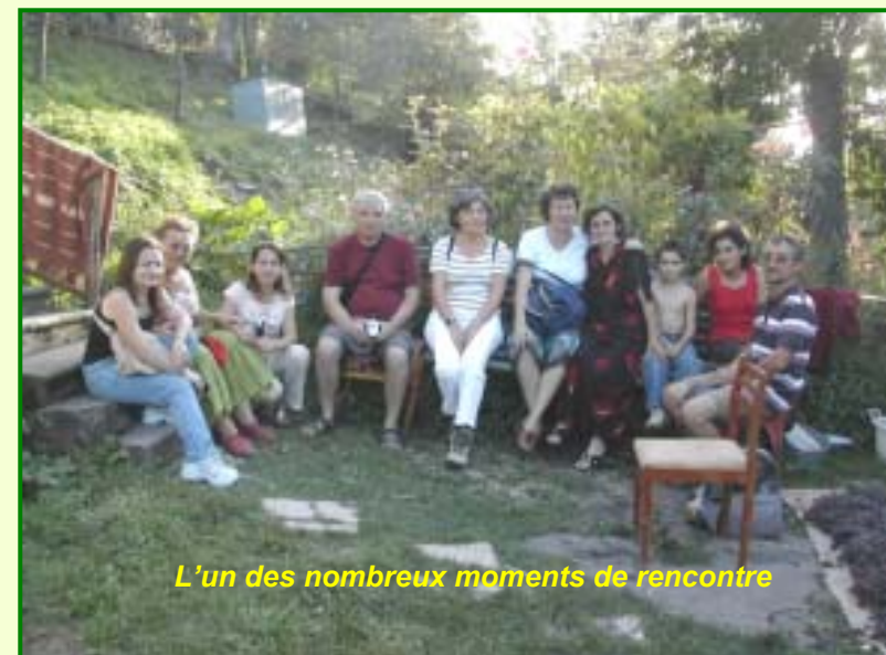
L'un des nombreux moments de rencontre

Quel peuple ! L'association Arégouni qui nous reçoit et organise notre séjour saura nous le faire découvrir. Répartis dans cinq maisons, ce sont cinq familles qui s'ouvrent