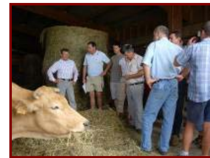
Un réseau d'agriculteurs qui se forment

Aujourd'hui, dans la continuité des engagements fondateurs et dans un souci constant d'indépendance, le réseau des Civam participe à renforcer les capacités d'initiatives des agriculteurs et des ruraux pour maintenir des campagnes vivantes et accueillantes par un développement durable et solidaire.